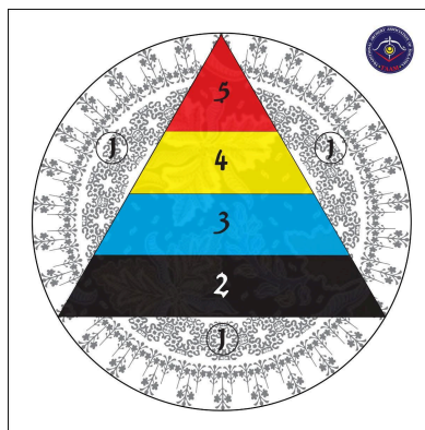
Target Face Rasmi TAAM - Diameter 80cm